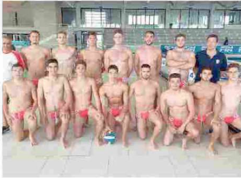
La Rari Under 20 che ha concluso ieri a Ostia le finali per il titolo