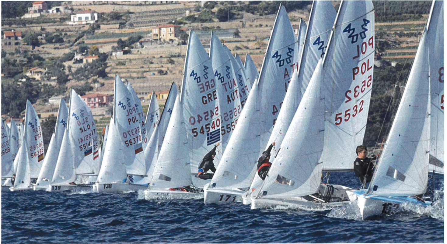
Campionato mondiale Frecciarossa 2021 2020